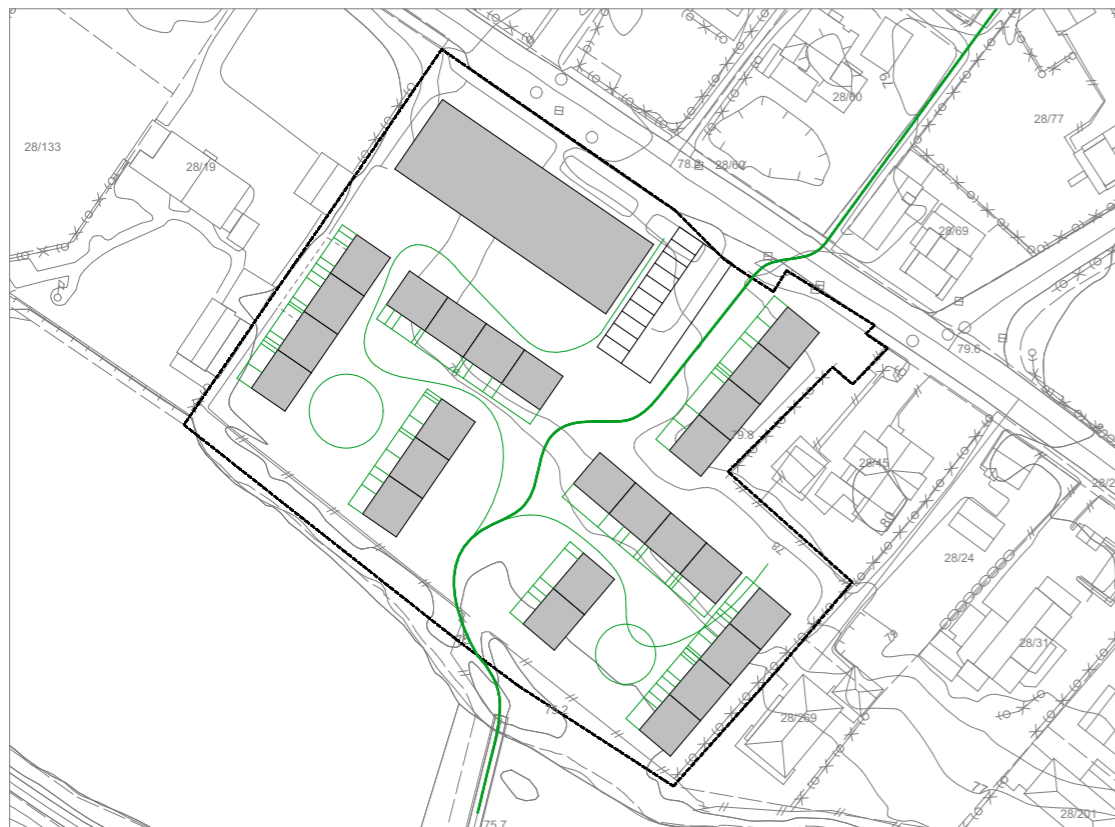
3 : VARIERT BO- OG TJENESTE TILBUD FOR ELDERE