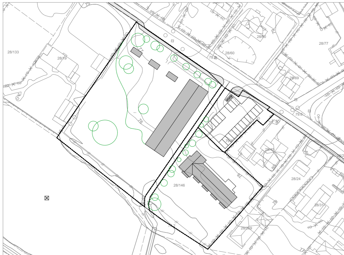
1 : BARNEHAGE OG KOMMUNALE BOLIGER