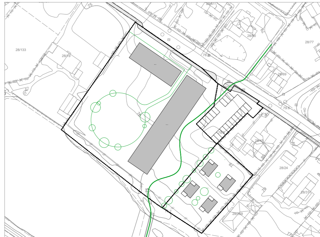
2 : OMSORGBOLIGER FOR ELDERE I BOFELLESKAP / AKTIVITETSSENTER / SMÅHUS FOR RUSOMSORG