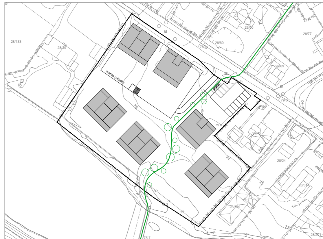
4 : BOLIG (HØY UTNYTTELSE)

Figgjo gamle skole / Sandnes Tomteselskap